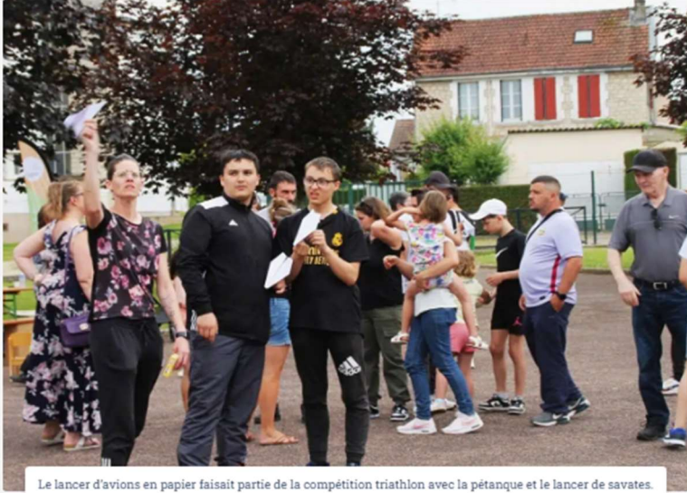
Le lancer d'avions en papier faisait partie de la compétition triathlon avec la pétanque et le lancer de savates.