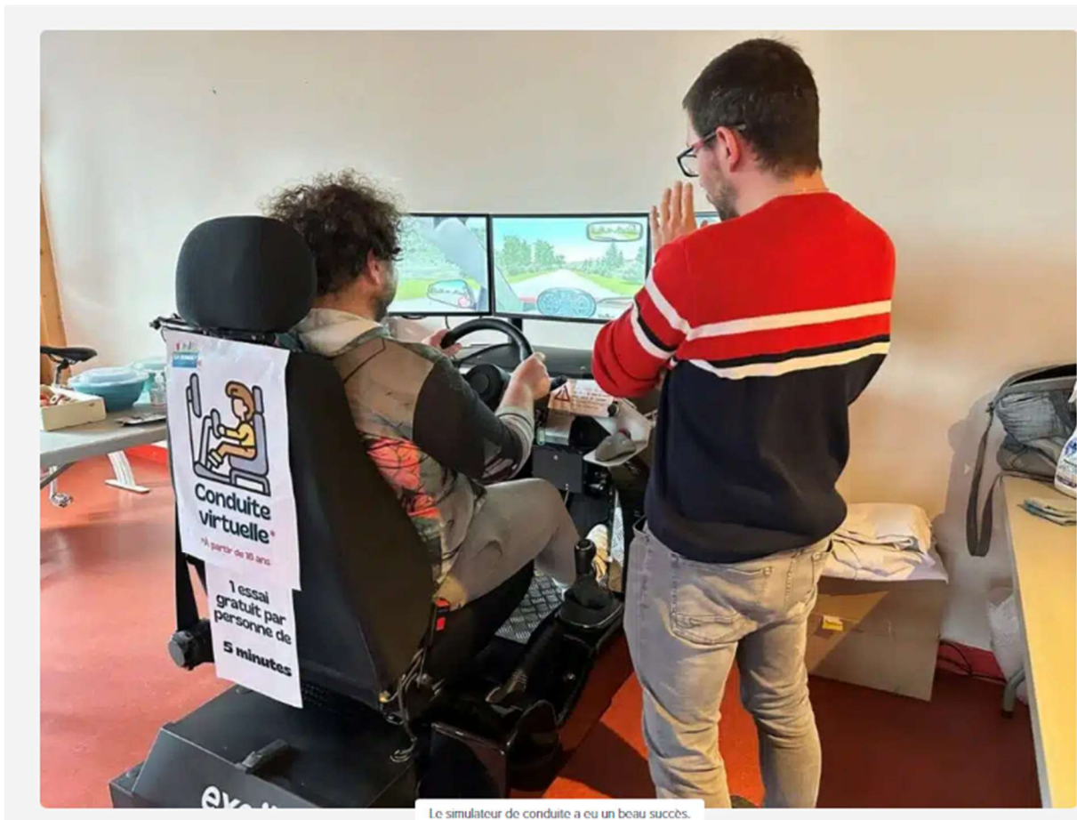
Le simulateur de conduite a eu un beau succès.

Le programme de la journée comprenait également un parcours d'obstacles, un simulateur de conduite, des jeux et ateliers variés, et même un mini marché solidaire. Toutes les animations étaient gratuites, rendant cet événement aussi accessible que divertissant.