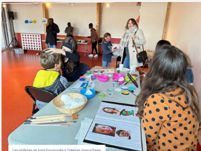
Les enfants se sont bousculés à l'atelier maquillage.